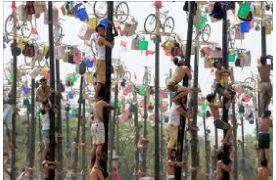
Celebración del día de la independencia en Indonesia