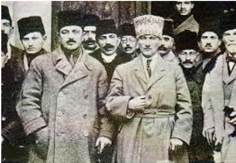
Mustafa Kemal (en el centro) rodeado por los delegados al Congreso de Sivas, 1919.

En el norte y noreste se vieron apoyados por la multiculturalidad. Buscaban la solidaridad en todos los países de lengua árabe.